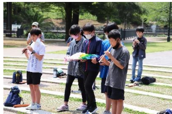
平和集会で千羽鶴を供える