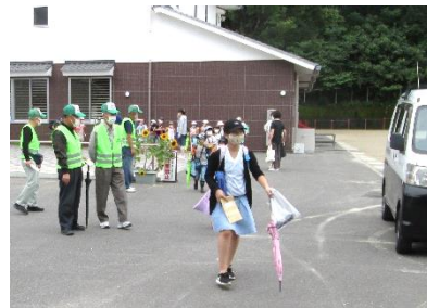
定例会後には、集団下校の見守りも

本年度も、防犯ふれあい隊の皆さまには、早朝から主な交差点等に立っていただき、交通指導や見守り活動をしていただいています。子供たちはもちろん、私たちが当たり前風景と思ってしまっているのですが、継続は力なりで、ずっと続けていただいているお陰で安全が維持できていると思います。毎月一度集団下校の日に合わせて定例会を開かれ、学校行事等の確認等も行っただき、臨機応変に対応いただいております。学校としても大変助かっています。心より感謝申し上げます。今後とも、どうぞよろしくお願いいたします。