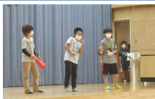
特技を披露する子どもたち