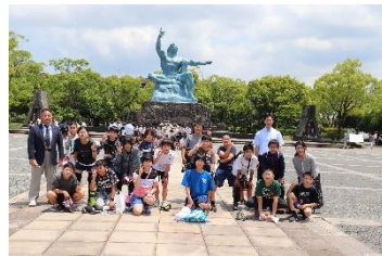
平和公園で記念写真を撮る