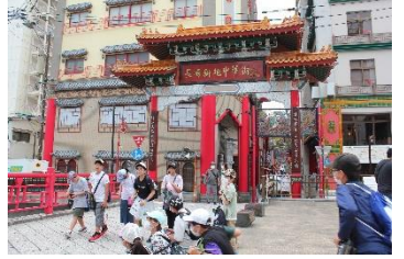
中華街で昼食を摂る