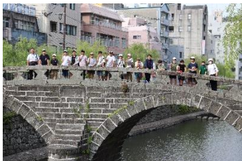
めがね橋で記念写真を撮る