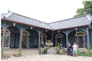
グラバー庭園を巡る